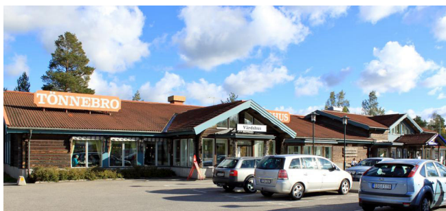
Söderhamn Tönnebro 1:5